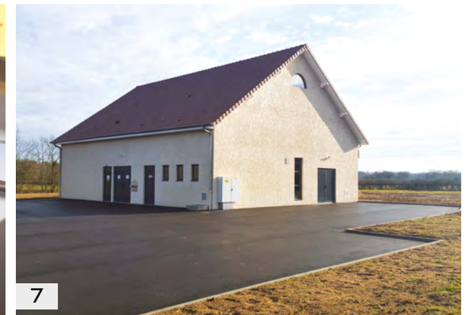
1/ Ferrailage PH RdC 2/ Coffrage filtres 3/ Pose de prémur 4/Coulage prémurs 5/ Caniveau BA coulé en place 6/ Filtres 7/ Vue d'ensemble